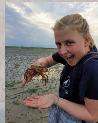
Die Strandkrabben sind wieder da!

P.S.: Fall sich jemand fragt was der Unterschied zwischen Seehunden und Robben ist: Seehunde zur Familie der Robben, das heißt, jeder Seehund ist eine Robbe, aber nicht jede Robbe ist ein Seehund.