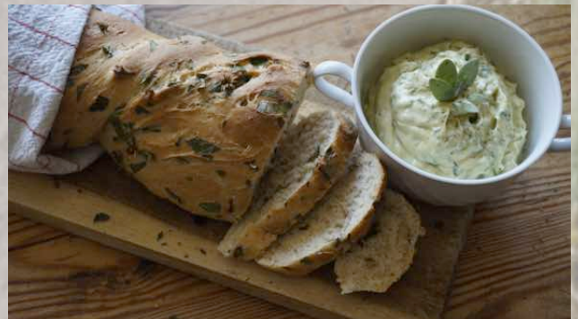
„Unkraut“ in anderer Form..

Eine meiner liebsten Aufgaben war es nämlich, aus gesammelten, essbaren Pflanzen ein Mittagessen zu kreieren – so gab es bei mir Brennessel-Giersch-Baguette mit Portulak-Keilmelden-Kräuterbutter, und diese grüne Kombination hat weder geschmacklich noch optisch zu wünschen übrig gelassen.