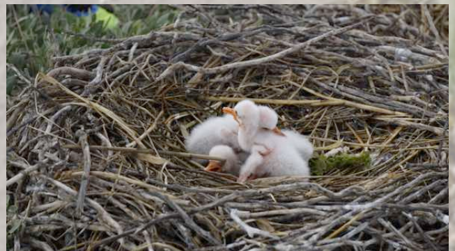
Löfflernest mit Küken

Dort haben wir uns von der Flut einschließen lassen und sind während dieser Tide über die Hallig gegangen. Dabei zählten wir neben den Elternvögeln, die uns wild umkreisten, die Jungvögel. Einige waren schon verhältnismäßig groß, während andere noch im Nest verkrochen eng zusammen lagen.