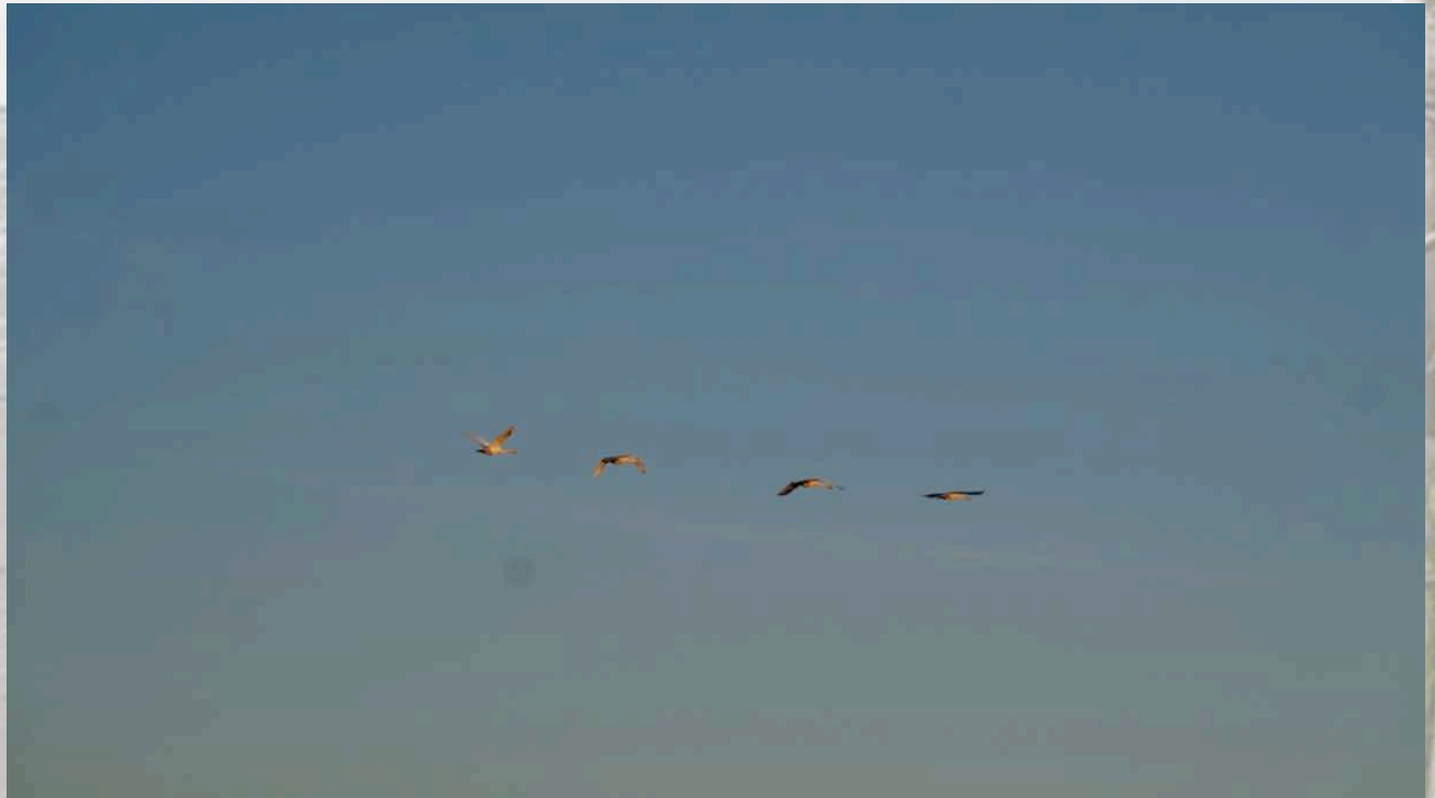
Singschwäne auf der Durchreise