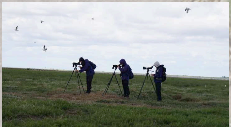
Konzentriertes Ringablesen auf Hallig Südfall