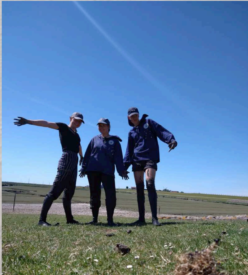
Schlick ist schick – auch bei der Brutvogelkartierung...