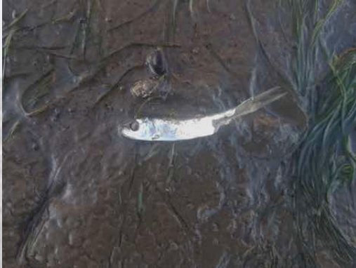
Toter Junghering am Dreisprung

Wattenmeerküste ein: Es wurden teilweise tausende verendete oder geschwächte Fische angespült oder lagen im Watt verteilt. Wir sichteten auf einer Wattstrecke von 100m ca. 50 Tiere.