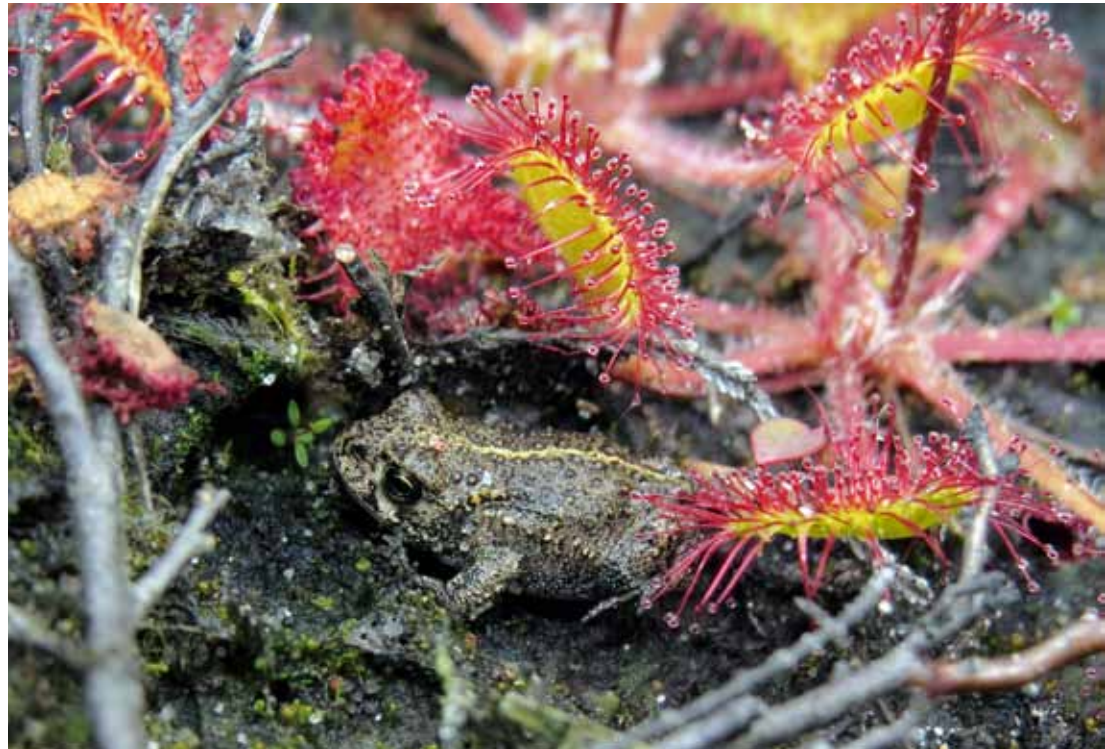
Trocknen Dünentümpel aus, verschwinden Kreuzkröten und Sonnentau

den Kreuzkröten auch hier der offene Sand. Da keine natürliche Verbesserung der Situation zu erwarten ist, wird jetzt ein Projekt zur Klimaanpassung der Dünentäler diskutiert. ■