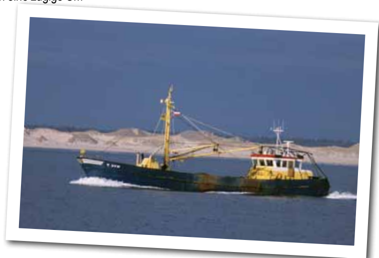
Muschelkutter im nordfriesischen Wattenmeer

Saatmuschelfangfahrt des Kutters „Siebennus Gerjets“ am Vormittag des 1.10.2013 vor der Sandbank von Westerhever. Zugleich wurde die Muschelbank mit ähnlicher Intensität von den Schiffen „Trijntje“ und „Adriaan“ bearbeitet. Nach der Vereinbarung ist dieses hier bzw. in vier der acht großen Wattstromsystemen nicht mehr möglich.