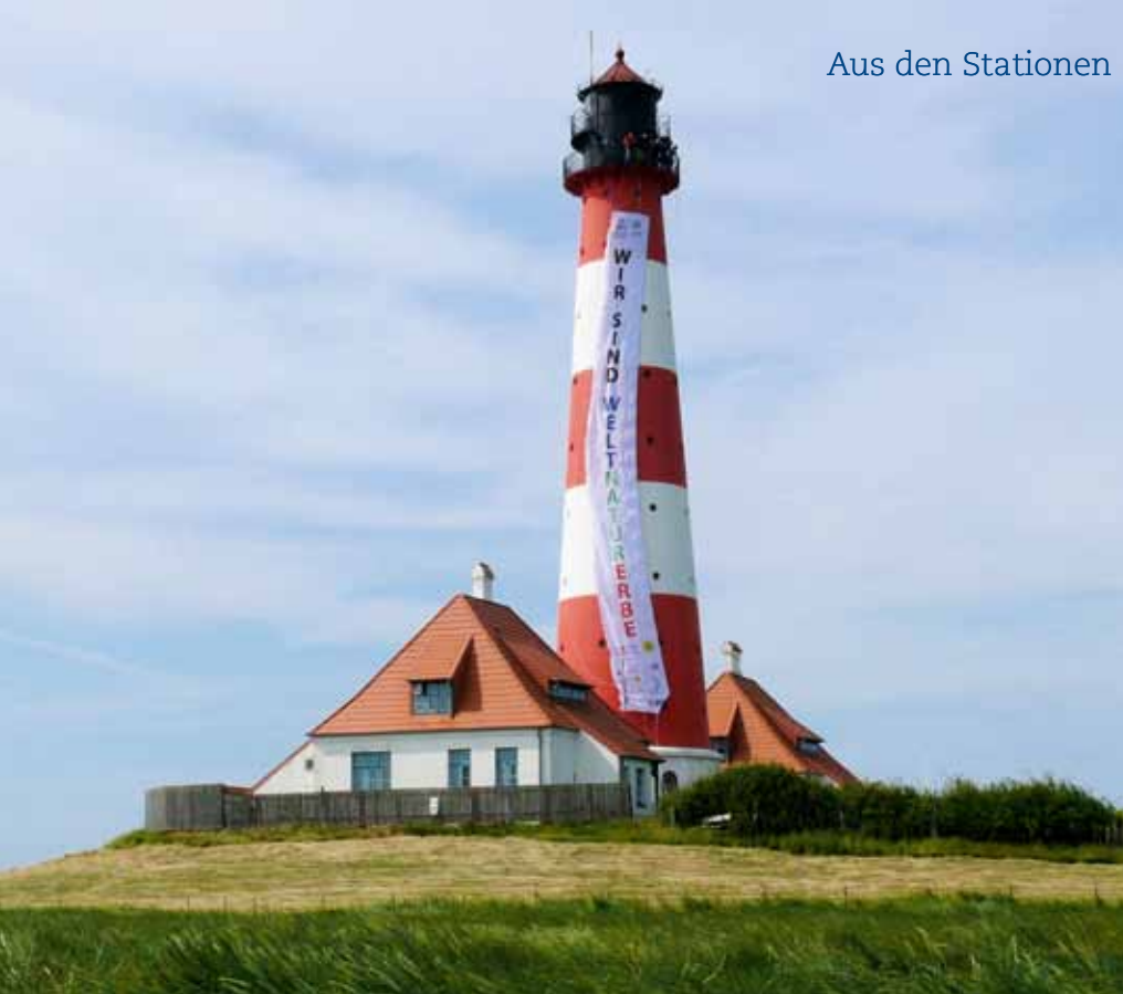
Immer wieder ist Westerhever mit der Station und dem Turm in den Medien präsent – hier bei der Feier zur Anerkennung des Wattenmeers als Weltnaturerbe im Juni 2009