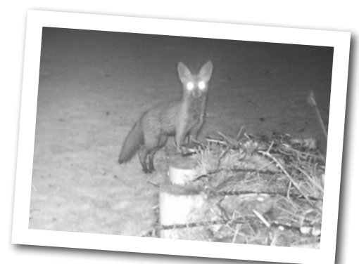
Kurz vor Mitternacht überraschte eine automatische Kamera mit Bewegungsmelder und Infrarotblitz diesen Fuchs am Ende einer Lahnung