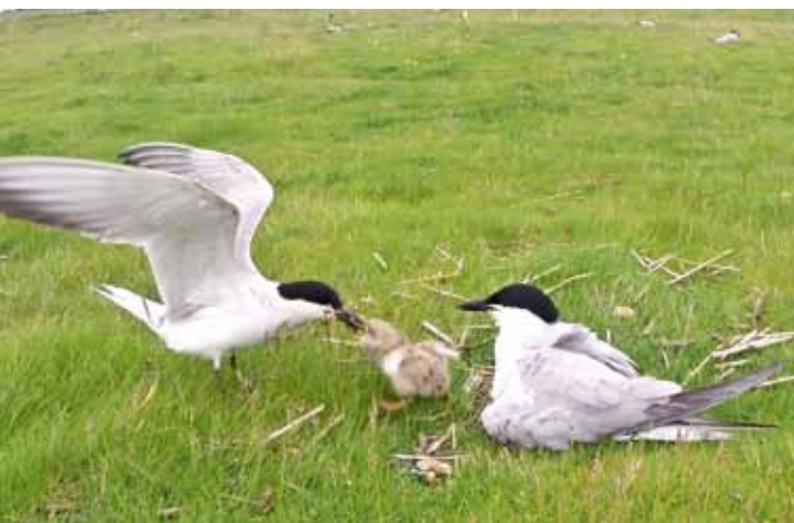
Anfang Juli fütterten zahlreiche Lachseeschwalben ihre Jungen

Junge den Füchsen zum Opfer, so dass nur etwa 20 tatsächlich flügge wurden. Trotzdem ein Erfolg, der Hoffnung für die nächsten Jahre macht. ■