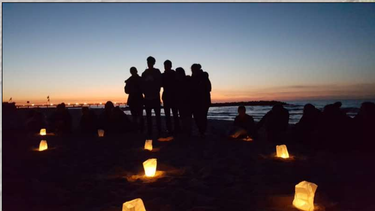
Der letzte Abend

Am Mittwoch kam eine Frau, die in einem Ökodorf lebt. Sie erzählte uns, wie das Leben im Ökodorf abläuft und brachte uns ihren Lebensstil näher. Ein Lebensstil, der viel auf Vertrauen basiert und in großem Umfang nicht klappen würde. Sie hat sich gegen Ende bei mir unbeliebt gemacht, als sie sagte, dass sie nur so viel arbeiten würde, dass sie keine Steuern bezahlen muss. Weil Steuerzahler alle die Waffenexporte etc. unterstützen würden. Diese Aussage ist einfach dreist und unsolidarisch. Steuerzahler unterstützen einen funktionierenden Staat. Ich heiße auch keine Waffenexporte gut, aber es ist ein sehr geringer Prozentsatz des Steuergeldes, welcher für „unmoralische“ Sachen genutzt wird. Wer sich für einen solchen Lebensstil interessiert und sich näher damit befassen möchte, der sucht nach dem „Ökodorf Sieben Linden“. Das ist der Name, des Ökodorfs.