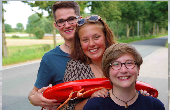
Hier zu sehen: Drei BFD- Generationen

Nehmt es mir nicht übel, mehr als 10 Stunden habe ich meinen Kopf zermürbt, um auch nur ansatzweise einen klaren Gedanken für einen Artikel fassen zu können - nur ein Gedanke schwebte mir im Kopf: „Dies ist mein letzter Artikel und danach ist es vorbei!“.