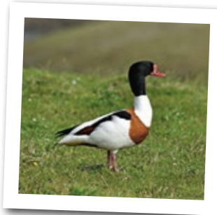
Der Erpel der Brandgans ist am roten Höcker auf dem Schnabel zu erkennen.

Eigentlich ist diese Art eher eine Ente als eine Gans. Zwar sprechen der lange Hals und die ähnliche Färbung beider Geschlechter für „Gans“, die Paarungsweise (Saison- statt Dauerehe), das bunte Gefieder und die Ernährung von Kleintieren statt von Pflanzen jedoch für „Ente“. Trotzdem hat sich der Name Brandgans eingebürgert.