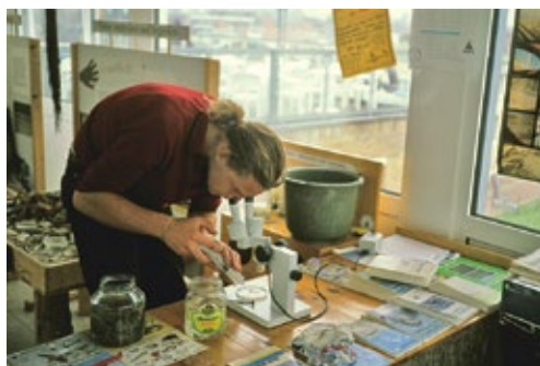
In der alten Büsumer Ausstellung