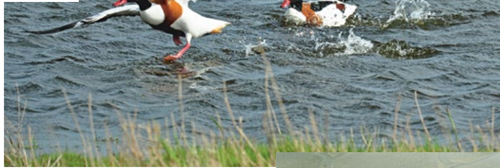
Gute Bruthöhlen sind rar und im Frühjahr heiß umkämpft