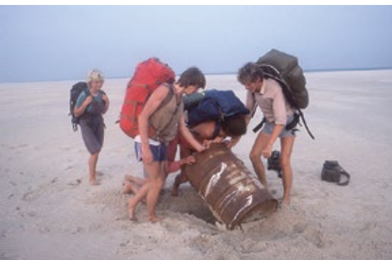
Süderoogsandkontrolle im Sommer 1983

Aber auch in diesem Bereich war die Schutzstation schon viel länger aktiv. Erste Ringelgans- und Brutvogelzählungen gab es schon regelmäßig ab 1962. Später arbeiteten in den Stationen des Vereins teilweise vollausgebildete Wissenschaftler als Zivildienstleistende. Sie brachten die Gedanken und die Methodik für Langzeitbeobachtungen von ihren Unis mit und realisierten schon in den siebziger Jahren Monitoring-Projekte. Einige Vorhaben werden bis heute weitergeführt. Legendar dabei die Zählungen auf dem Süderoogsand, waren sie doch mit Übernachtungen in der Bake auf dem Sand verbunden. Heutzutage allerdings abgelöst durch 18-Stunden-Märsche.