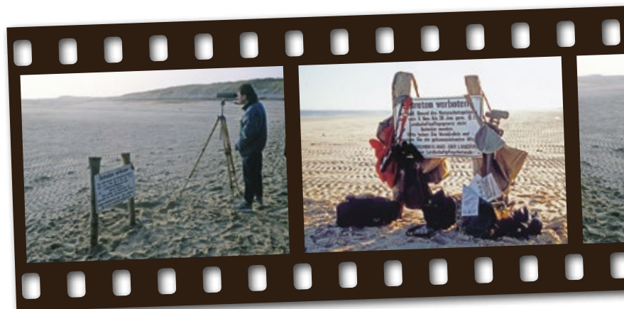
Bewachung der komplett abgesperrten Hörnummer Odde