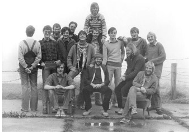
Ziviseminar 1981 auf der Langenesser Peterswarf. Bereits damals waren auch Zivis der Naturschutzgemeinschaft Sylt, des Bundes für Lebensschutz und der Aktionsgemeinschaft Nordseewatten dabei.

Gleich im November 1982 führte die Schutzstation ihr zwanzigjähriges Jubiläum in Form einer mehrtägigen Arbeitstagung durch. Eine Vielzahl neuer Projekte wurde angestoßen, so begann z.B. die Planung einer neuen