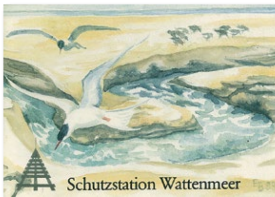
Broschüre zum 25. Vereinsjubiläum

1987 fand in Büsum die 25-Jahr-Feier der Schutzstation Wattenmeer statt. Bei diesem Treffen stand die Bilanz der letzten beiden Jahrzehnte im Vordergrund. Inzwischen waren über 20 Stationen entlang der Westküste gegründet worden und jedes Jahr arbeiteten bis zu 40 Zivildienstleistende in den Zentren.