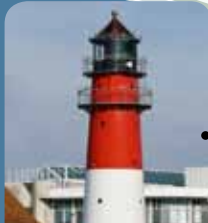
Büsumer Leuchtturm Treffpunkt: Wattwanderungen, Nachtwanderung