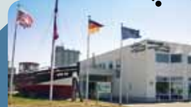
Museum am Meer Treffpunkt: Vorträge und Wattexperimente