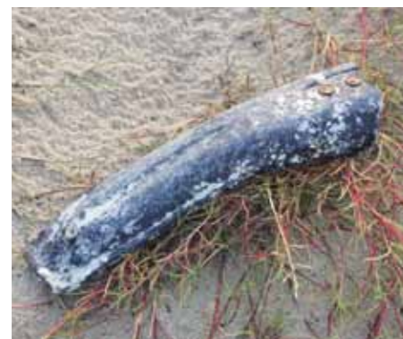
Typisch sind auch solche Fahrradteile. Rost und Spuren von Seepocken zeugen von langer Zeit im Wasser.

Durch den Wellengang geriet die „MSC Zoe“ in starke Rollbewegungen d. h. sie krängte wechselweise stark nach links oder rechts. Weil das Schiff mit seiner enormen Breite sehr stabil ist, richtete es sich jeweils „sehr schnell und ruckartig wieder auf“. Möglicherweise hatte es im relativ flachen Wasser auch Grundberüh-