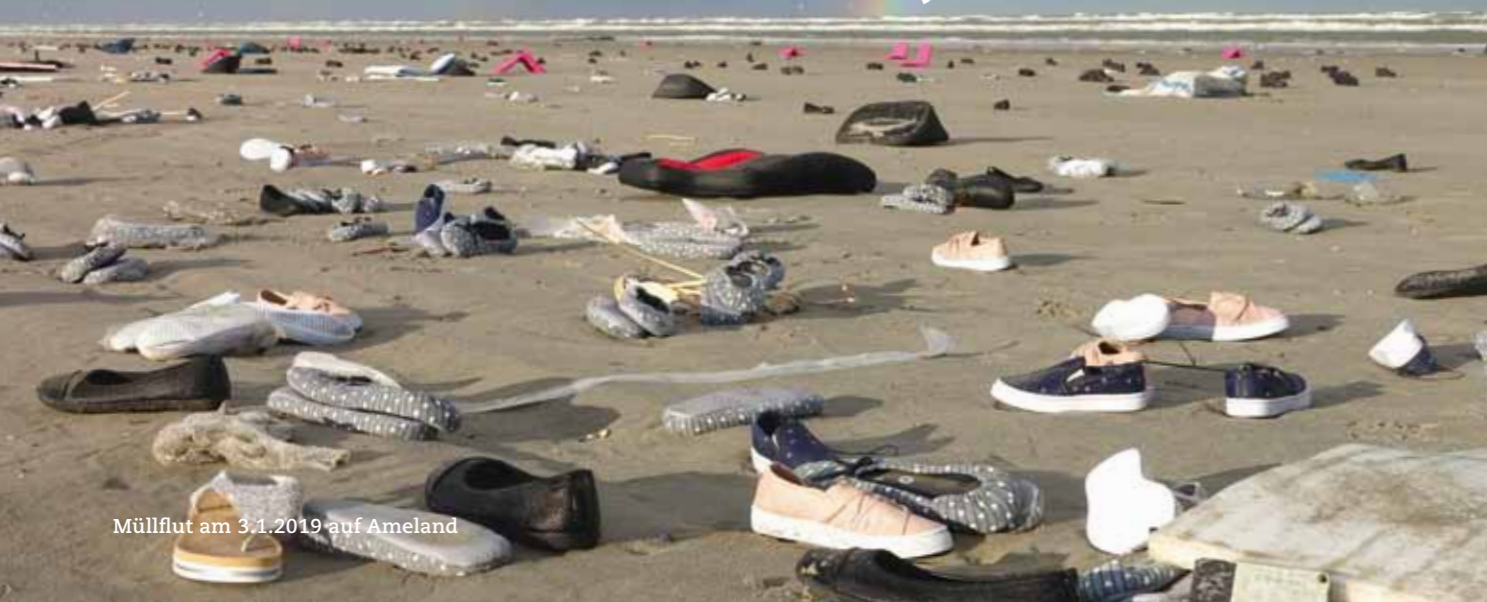
Müllflut am 3.1.2019 auf Ameland

„Containerschiffe werden immer größer und der Anteil großer Schiffe in der Flotte“ steigt. „Die Untersuchung offenbart, dass das Konzept zur Laschung von Containern an Deck auf diesen großen und breiten