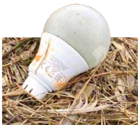
Weit verbreitete Gegenstände aus der Ladung der MSC Zoe: Wie viele zuvor wurden dieser LED-Lampen-Rohling und die Plastik-Orchidee (auf Seite 8) am 2.1.2021 genau zwei Jahre nach der Havarie in einem frischen Spülsaum vor Eiderstedt gefunden.

rungen. Die hierbei „aufgetretenen Querbeschleunigungen befanden sich nahe den Auslegungsgrenzen und führten zu einem Versagen der Containerstruktur und/oder des Laschmaterials und darauffolgendem Überbordgehen von Containern.“