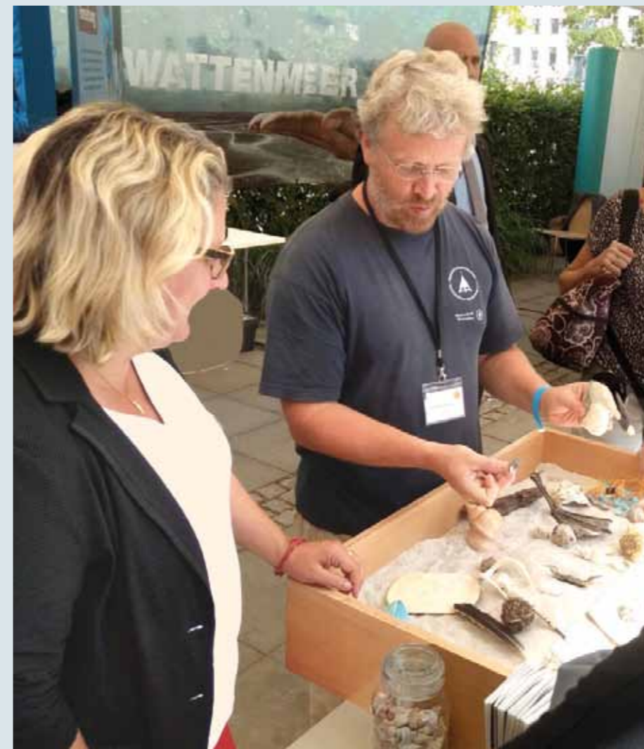
Mit Bundesumweltministerin Svenja Schulze am Infostand zum BeachExplorer am 17.8.2019 in Berlin.