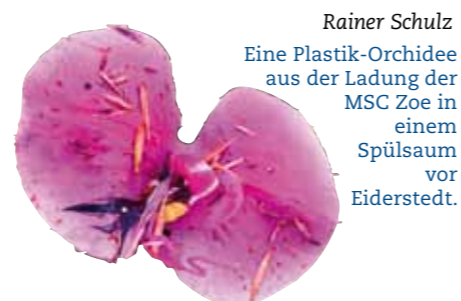
Rainer Schulz Eine Plastik-Orchidee aus der Ladung der MSC Zoe in einem Spülsaum vor Eiderstedt.