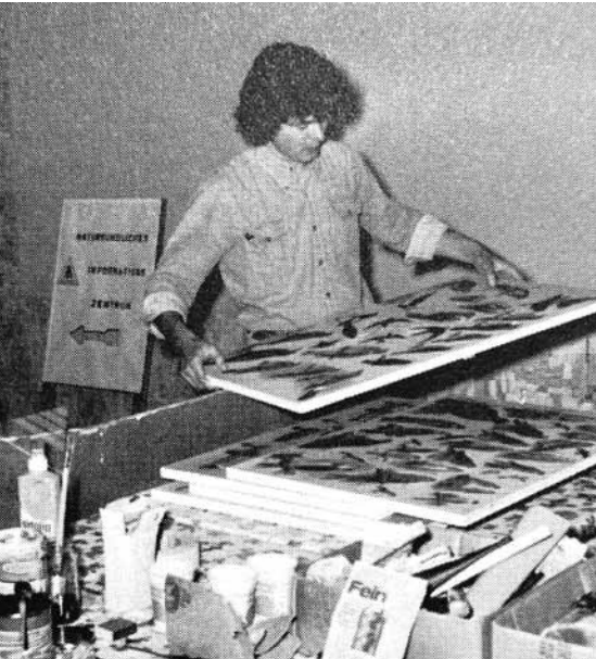
Mit „Hilfsmitteln und vielfältigem Anschauungsmaterial“ bei der Vorbereitung der Ausstellung in Wyk